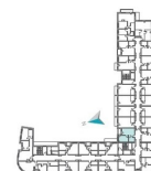
PRZYKŁADOWE MIESZKANIE DOSTĘPNE W OFERCIE